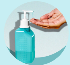
Lavado de manos